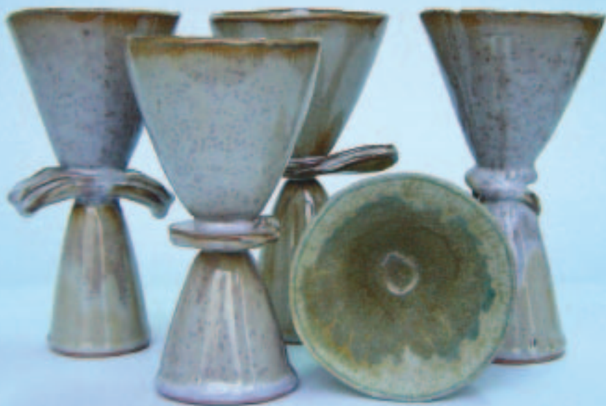
V/M artesanía SC, stand 15