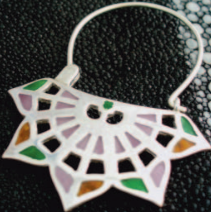
Ardentia, diseño en prata, stand 37