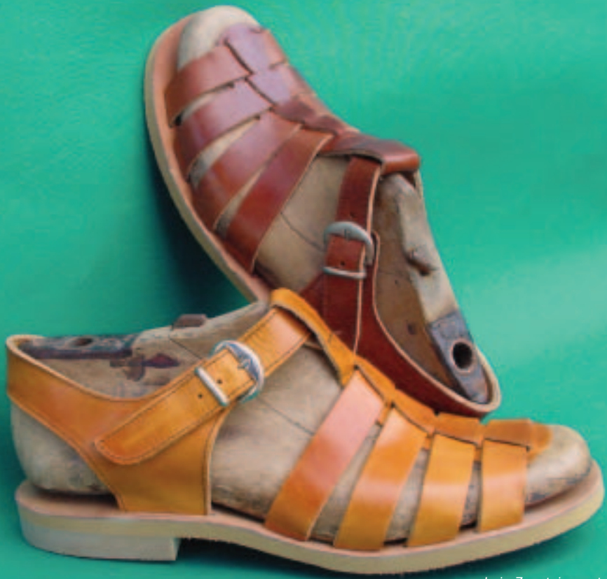
Laia Zapateiros, stand 40